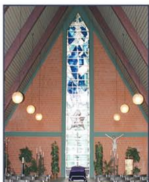
Die Friedhofskapelle "Christus, unsere Auferstehung"

Den Propsteifriedhof, Saarlandstraße 35 (eine Stichstraße der Saarlandstraße), erreicht man auch über die Straße „An der Papenburg“.